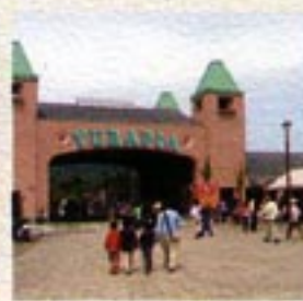
丹後あじわいの郷 当館より車で約10分