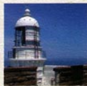
経ヶ岬 当館より車で約45分