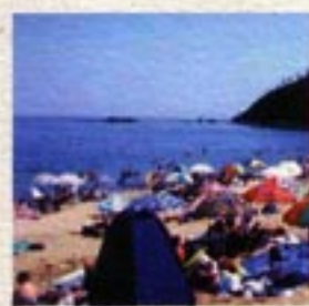
八丁浜海水浴場 当館のすぐ目の前。